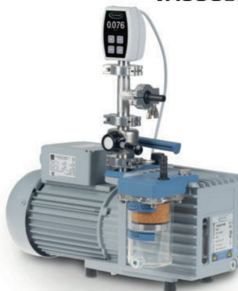
RZ 6+FO+VS 16+VACUU-VIEW extended

Las potentes bombas rotativas de paletas son ideales para aplicaciones de laboratorio y proceso que requieren un vacío final muy bueno con un caudal de gas de medio a elevado. Las aplicaciones típicas son la liofilización, la destilación al vacío fino y las cámaras de secado.