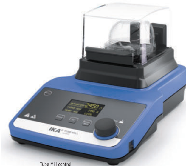
Tube Mill control

Adecuado para cámaras de molienda desechables y reutilizables.