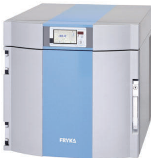
B 35-85 //logg

Estos equipos son pequeñas unidades de mesa para enfriar y congelar en todos los laboratorios. Gracias a su diseño compacto que ahorra espacio y a la unidad de refrigeración silenciosa, este equipo es adecuado para el uso directo en el lugar de trabajo.