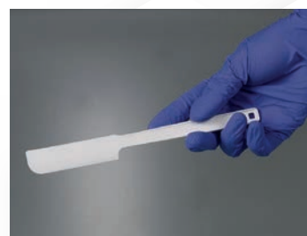
Espátula de muestreo desechable, PE verde, estéril