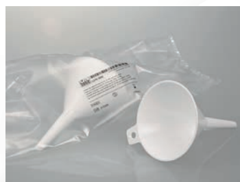
Embudos de polvo desechables, Bio PE, estériles, blancos