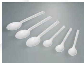
Cucharas desechables PE verde, estériles