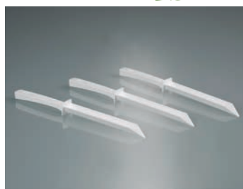
Espátulas desechables, PE verde, estériles