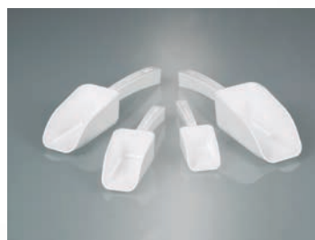
Palas desechables, PE verde, estériles