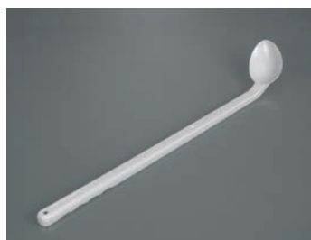
Cucharas desechables, curvadas mango largo, PE verde, estériles