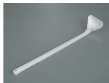
Cucharas desechables, mango largo, PE verde, estériles