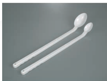
Cucharas desechables, mango largo, PE verde, estériles