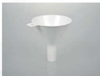
Embudos de polvo desechables, Bio PE, estériles, blancos