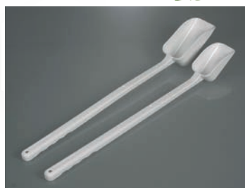
Palas desechables, mango largo, PE verde, estériles