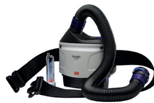
3M™ Versaflo™ Powered Air Turbo Starter Kit, TR-300+