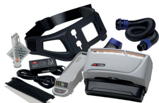
3M™ Versaflo™ Powered Air Turbo TR-600