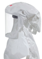
3M™ Versaflo™ S-Series Capuchas y cubrecabezas