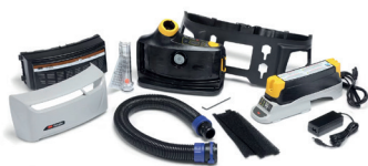
3M™ Versaflo™ Powered Air Turbo TR-800