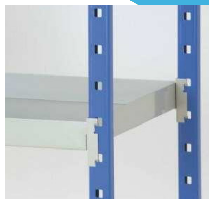
Baldas de acero tipo cubeta