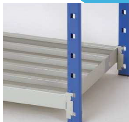
Baldas de acero con rejilla